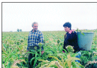
Συγκομιδή αγκινάρων ποικιλίας Ασπρη Κιτίου

Η προσθήκη οργανικής ουσίας έχει ως αποτέλεσμα τον εμπλουτισμό του εδάφους σε θρεπτικά στοιχεία και μικροοργανισμούς, άρα βελτιώνεται η γονιμότητα του. Επιπλέον, βελτιώνεται η δομή και η υφή του.