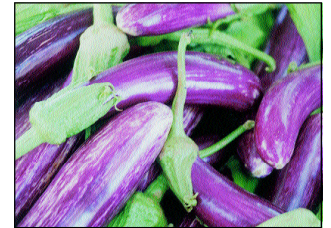
Μελιτζάνες ποικιλίας Ακανθούς

Το έδαφος, εκτός από μέσο στήριξης των φυτών, αποτελεί και την πηγή παροχής θρεπτικών στοιχείων. Δεν νοείται βιολογική καλλιέργεια χωρίς το σεβασμό και την ενδυνάμωση του παράγοντα έδαφος. Το έδαφος είναι ένας ζωντανός οργανισμός και χρειάζεται ειδικούς χειρισμούς ώστε να μπορεί να «αντέξει» την καλλιέργεια λαχανικών, ενώ, ταυτόχρονα, είναι ο παράγοντας εκείνος που θα επηρεάσει αποφασιστικά το ύψος της παραγωγής αν οι υπόλοιποι παράγοντες που επηρεάζουν την παραγωγή διατηρηθούν σε κάποιο βαθμό υπό έλεγχο. Τα βασικά στοιχεία που πρέπει να προσέξει ο βιοκαλλιεργητής είναι η διατήρηση της δομής, της υφής και της γονιμότητας τους εδάφους. Το έδαφος, ως φυσικός πόρος, δεν είναι ανεξάντλητος, αλλά χρειάζεται συστηματικό εμπλουτισμό και διατήρηση. Το εργαλείο που έχει ο βιοκαλλιεργητής γι' αυτό το σκοπό είναι η προσθήκη οργανικής ουσίας. Στα εδάφη ενσωματώνουμε οργανική ουσία με την προσθήκη κοπριάς, κομπόστας και ενσωμάτωση υπολειμμά-